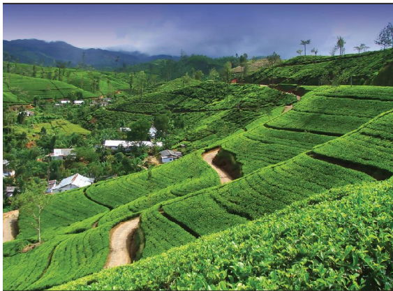
պլանտացիաներ Շրի Լանկայում

Նեպալը տնտեսական առումով աղքատ երկիր է: Նեպալի և Չինաստանի սահմանին է գտնվում երկրագնդի բարձրագույն լեռը՝ Ջոնոլունգման: Տարբեր երկրներից ժամանող լեռնագնացներն այդ գագաթ են բարձրանում հիմնականում Նեպալի տարածքից, ինչը երկրին զգալի եկամուտ է ապահովում: Երկրի բնակչության 90 %-ը հինդուսներ են, լեզուն՝ նեպալի: